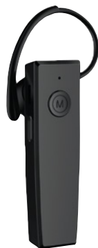
Albrecht ATR 430 Single Art.Nr.:29990