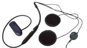
Für Jet-/Klapphelm BPA 300/O