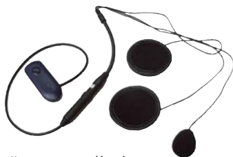
Für Integralhelm BPA 300/C